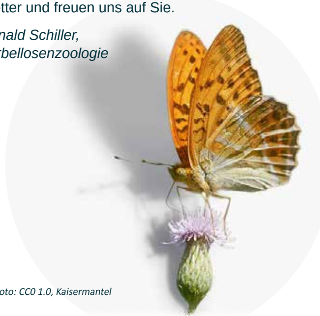
Kaisermantel