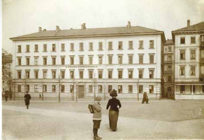
II. Höhere Bürgerschule am Schulplatz, Aufnahme um 1920

in der „Alten Burg“ gegessen (7000 M). – Den 8 Räumern je 5 Zigarren gegeben. Dann noch Trinkgeld verlangt, obwohl sie 30 000 M tarifmäßiges Trinkgeld bekommen. Unverschämt. – Die großen Tiergruppen gehen nicht durch die Türen. Vorläufig auf den Korridoren stehen lassen. – Umzug ohne jeden Glasbruch vor sich gegangen. Wespennest und Uferschwabengruppe sich vom Boden gelöst. – Einige Türen schwach beschädigt. – 7.25 ganz kaputt heimgefahren. – Die Karten für die heutige Kammermusik verfallen lassen, weil zu müde.“